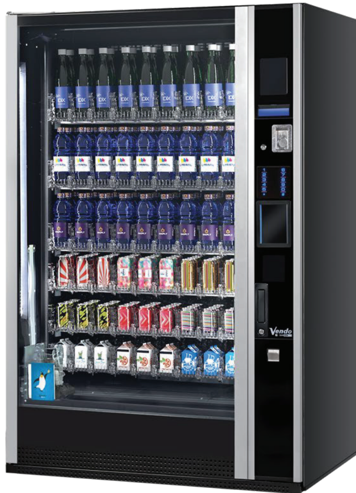
G-Drink Design 9 Vertical