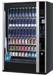
G-DRINK 9 DESIGN DV9