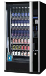
G-DRINK 6 DESIGN DC6